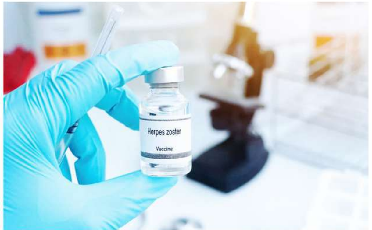
Descubrimiento. La vacunación contra el herpes zóster puede influir en los sistemas relevantes para el envejecimiento.

Los análisis incluyeron una muestra de 3.884 adultos mayores de 70 años, con dosajes de muestras de sangre, estudios celulares y evaluaciones físicas. Los resultados fueron sistematizados para ajustarlos a variables sociodemográficas y