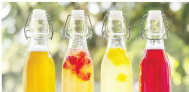
Sabrosa y saludable. La kombucha es otra bebida fermentada que tiene muchos adeptos.

"Debemos dejar de ver a todos los microbios como amenazas: la mayoría de ellos son nuestros aliados. Alimentarlos, protegerlos e incorporarlos mediante la dieta es una de las formas más simples y efectivas de cuidar nuestra salud", concluyó el doctor Tabacco. ■