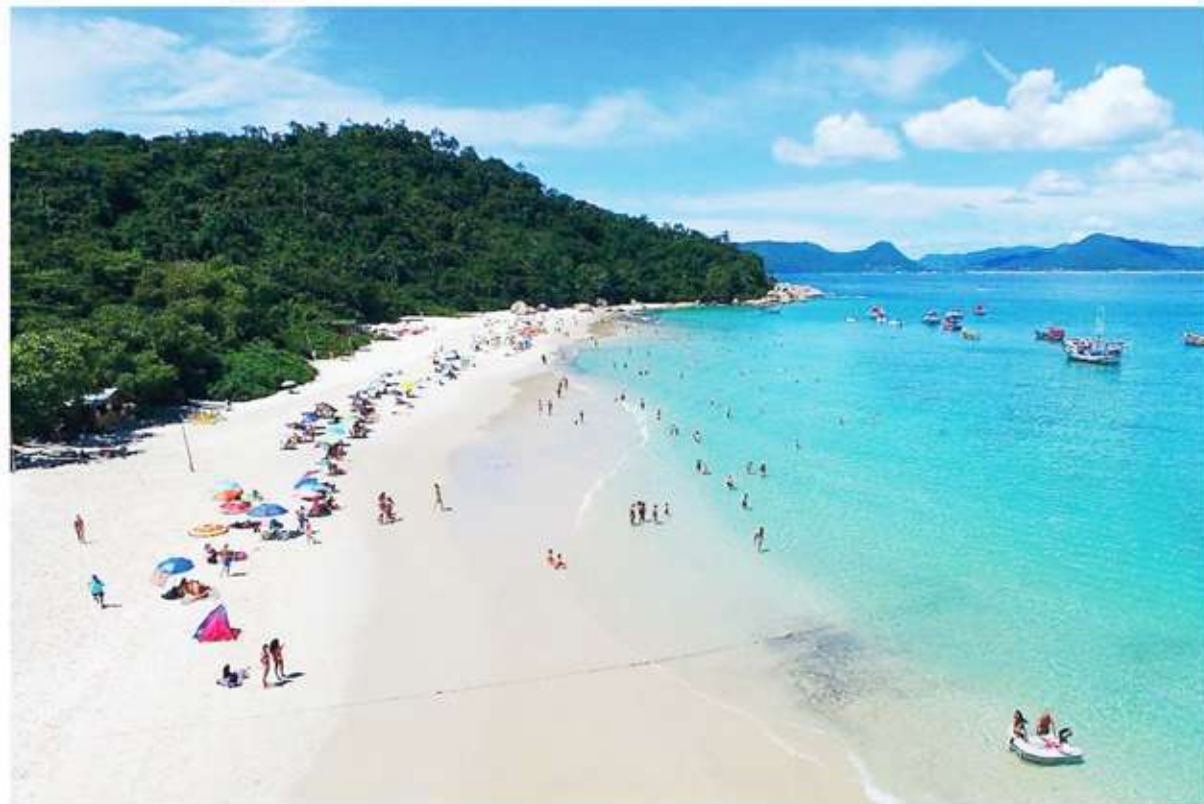
Precauciones. Cómo evitar el contagio de diarrea en las preciadas playas del sur de Brasil.

Autoridades sanitarias brasileñas reportaron que al menos 10 mil personas sufrieron diarrea en lo que va de la temporada de verano.