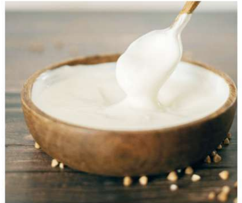
El gran fermentado. El yogur natural se posiciona como un alimento clave.

"El yogur es un producto de un elevado perfil nutricional por su aporte de calcio, proteínas y vitaminas, pero además agrega microorganismos vivos y, algunos, incluso determinados probióticos", afirmó el doctor Omar Tabacco, médico pediatra gastroenterólogo,